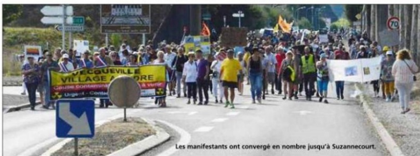
Les manifestants ont convergé en nombre jusqu'à Suzannecourt.

Les associations ayant appelé au rassemblement ont estimé à plus de 700 le nombre de personnes ayant manifesté hier après-midi entre Vecqueville et Suzannecourt.