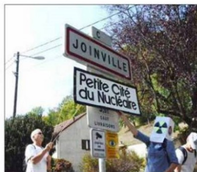
Joinville labellisée « Petite cité du nucléaire ».