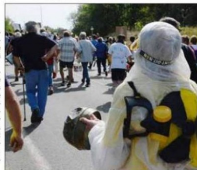
Beaucoup de « locaux » dans la manifestation.

Montage réalisé avec la page 1 et la page 2